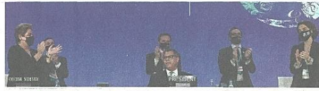
13日、英北部グラスゴーのCOP26会場で、拍手を受けるシャーマ議長（中央）

気温上昇幅については、2015年に採択された「協定」で、2度未満を目標とし、努力目標として1.5度を掲げた。条約事務局によると、1.5度以下に抑えるには30年の世界全体の温室効果ガスを10年比で45%削減