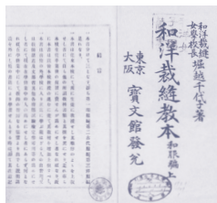
堀越 千代の著書『和洋裁縫教本』 和服編上(明治38年)の巻頭