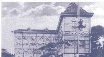
明治44年 3階建て新校舎